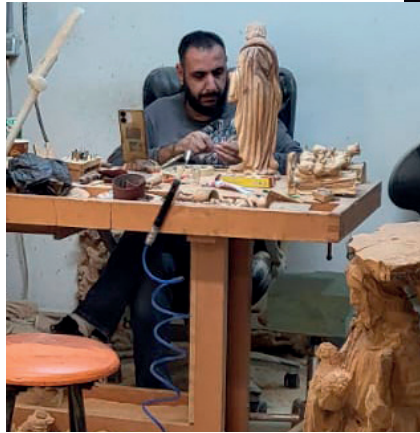
Artigiano al lavoro nel Piccirillo Handicraft Center

Èra il 1997 quando, da un pellegrinaggio a Betlemme e da una messa celebrata ai piedi dei pullman bloccati alle porte della città, nacque il primo germe della Fondazione Giovanni Paolo II. Quel gesto aprì il varco militare, ma aprì anche tanti cuori, per volontà dei primi fondatori, guidati da monsignor Luciano Giovannetti. La Fondazione non dimentica le sue radici e la "sua" Betlemme dove ha una sede, anzi ha rilanciato il proprio impegno nella Terra Santa al fianco dei partner con cui collabora