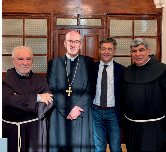
L'incontro tra il Cda della Fondazione e il Cardinale Pizzaballa